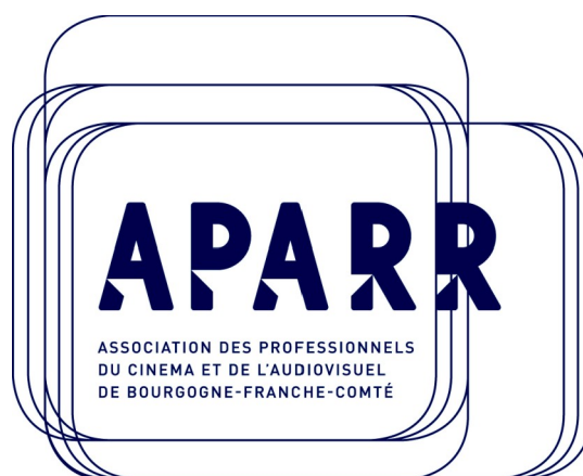
Illustration 3: Nouveau logo