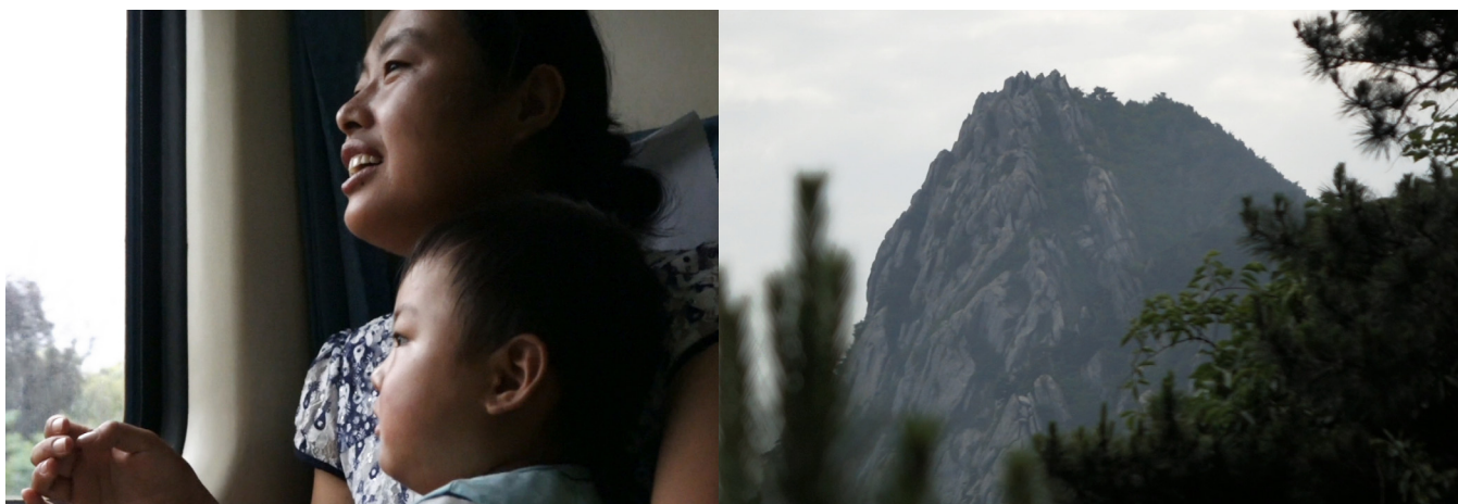
Je ne parle pas chinois

Du delta du Yangzi au désert de Gobi, le film trace le panorama d'une Chine magnifiée voire indéchiffrable, où peu à peu la parole se délie, et où affleure le témoignage d'une jeune femme sur son pays natal. Inspiré d'un roman de François Cheng, Le Dit de Tian-yi , ce film est un journal filmé qui tente de se rapprocher des descriptions sensibles que fait Tian-yi, le protagoniste du roman, du monde qui l'entoure. C'est aussi la tentative de revivre la découverte fraîche et naïve que fait ce jeune Chinois de la France, mais en inversant les rôles et la destination.